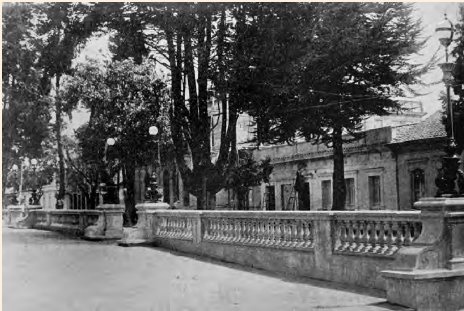
BALAUSTRADA DEL TERRAZA PASTEUR. 1924. REVISTA EL GRÁFICO.