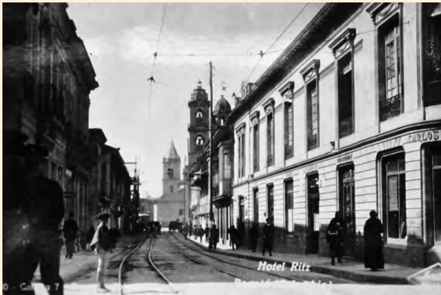
HOTEL RITZ EN LA ESQUINA DE LA CALLE SUR DE LA CALLE 17 CON SÉPTIMA. 1940.