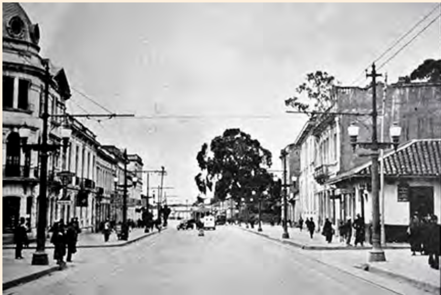
CALLE 24 CON CARRERA SÉPTIMA, VISTA HACIA EL NORTE.