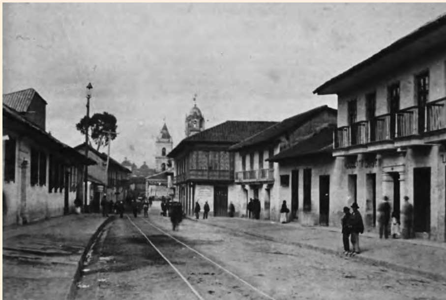
VISTA HACIA EL SUR DE LA CARRERA SÉPTIMA A LA ALTURA DE LA CALLE 17 Y 16. 1868. HENRY DUPERLY. COLECCIÓN MDB-IDPC.