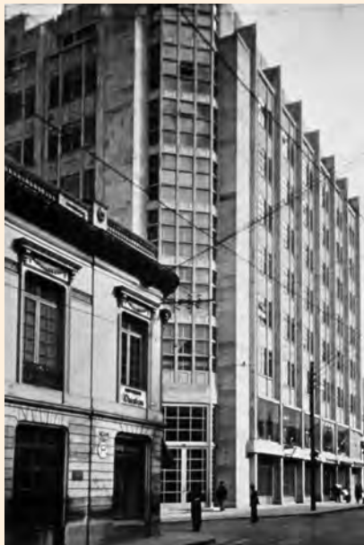
EDIFICIO DE LA COMPAÑÍA COLOMBIANA DE SEGUROS, ESQUINA NORTE DE LA CALLE 17 CON SÉPTIMA.