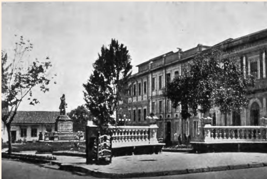
PLAZA DE CALDAS HACIA 1929.