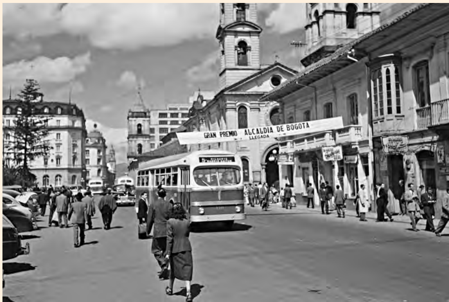
CALLE 16 FRENTE AL PARQUE DE SANTANDER 1952.