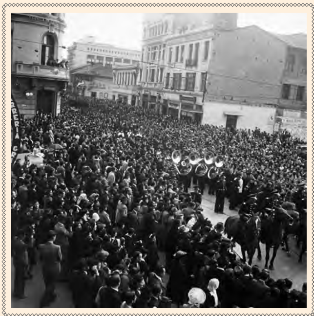
AGLOMERACIÓN DE GENTE EN LAS CEREMONIAS EN HONOR DE LA VIRGEN DEL CARMEN, SE VE EN PRIMER PLANO EL DESFILE MILITAR. 1943 DANIEL RODRIGUEZ. COLECCIÓN IDPC-MDB