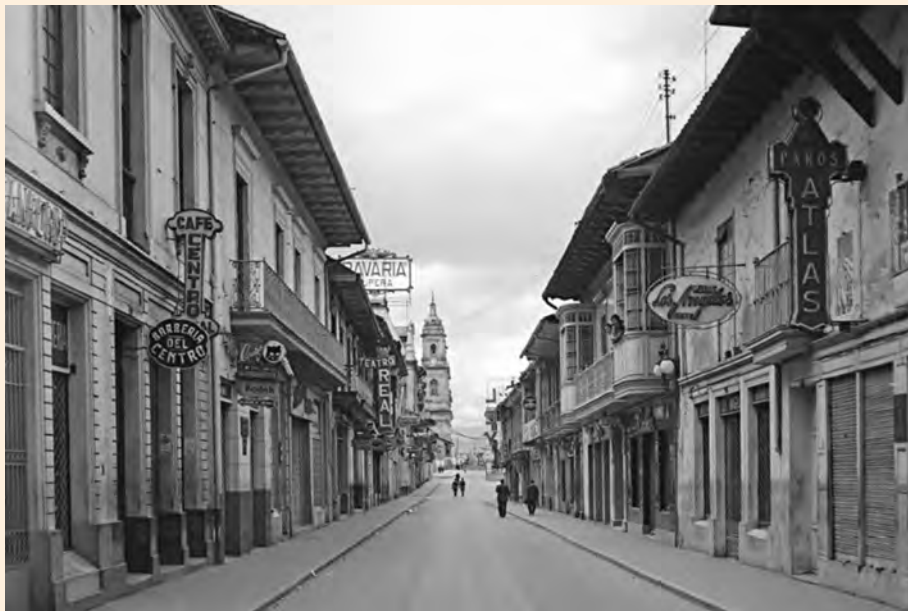
CARRERA SÉPTIMA ENTRE CALLES 14 Y 11, CA 1950.