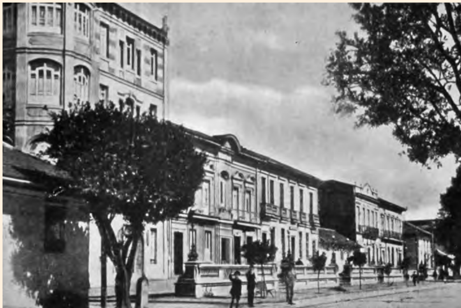
TERRAZA PASTEUR. CALLE 24, 1929.