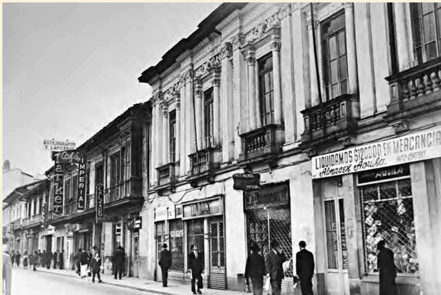
VISTA HACIA EL SUR DEL COSTADO ORIENTAL DE LA CARRERA SÉPTIMA ENTRE CALLES 13 Y 14. CASAS QUE FUERON DEMOLIDAS HACIA EL AÑO 1954.