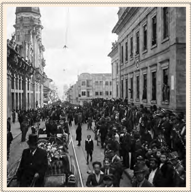
DESFILE A LA ALTURA DE LA CALLE 10. SE OBSERVA EL COSTADO ESTE DEL CAPITOLIO NACIONAL Y EL TORREÓN A LA BANDERA DEL COLEGIO MAYOR DE SAN BARTOLOMÉ.