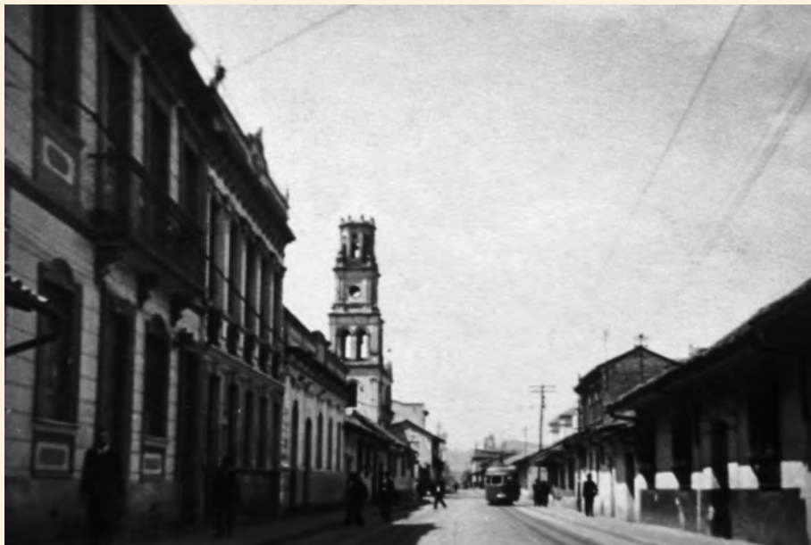
VISTA HACIA EL SUR DE LA CARRERA SÉPTIMA ENTRE CALLES QUINTA Y SEXTA. SE PUEDE OBSERVAR LA ANTIGUA TORRE DE LA IGLESIA DE SANTA BÁRBARA. 1930. ARCHIVO JJOR-SMOB.