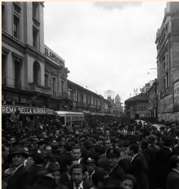
VISTA DESDE LA AVENIDA JIMÉNEZ CON CARRERA SÉPTIMA..