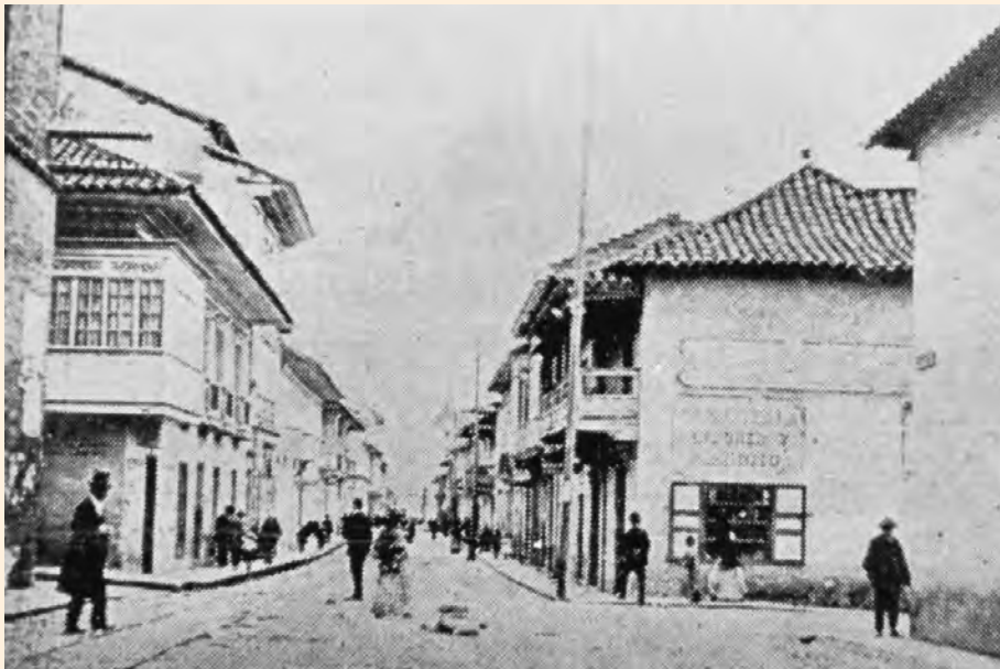
CALLE DE LA CARRERA. A LA DERECHA, LA CANTINA LA TORRE DE LONDRES. CALLE NOVENA. 1898. GRUTA SIMBÓLICA. COLECCIÓN MDB-IDPC.