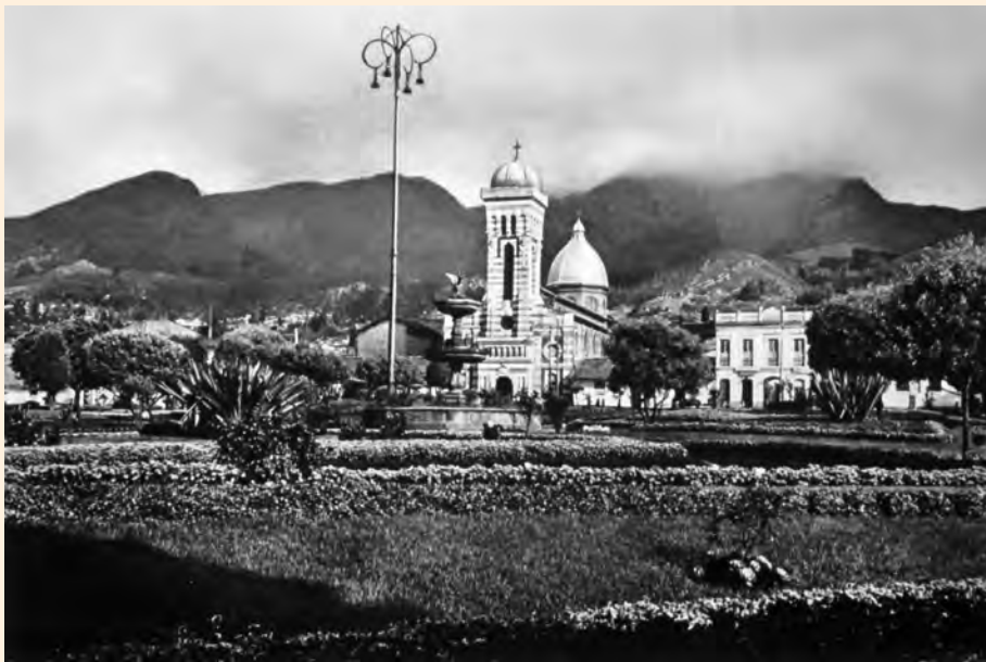
IGLESIA DE LA TRINIDAD Y PILA EN BRONCE DE LA PLAZA DE LAS CRUCES. 1938.