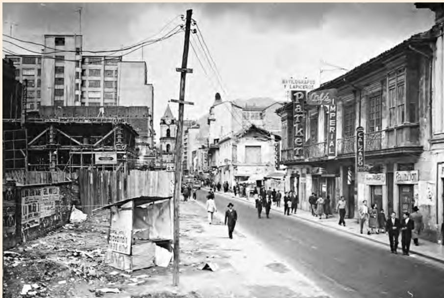
VISTA HACIA EL NORTE. AMPLIACIÓN DE LA CARRERA SÉPTIMA ENTRE CALLES 13 Y 14. ENERO 2 DE 1956.