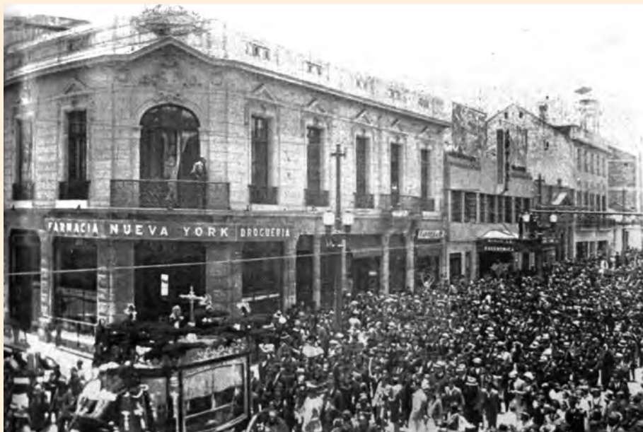
ANTIGUA CARROZA Y DESFILE FÚNEBRE EN 1936 A LA ALTURA DE LA CALLE 24 CON CARRERA SÉPTIMA. REVISTA EL GRÁFICO.