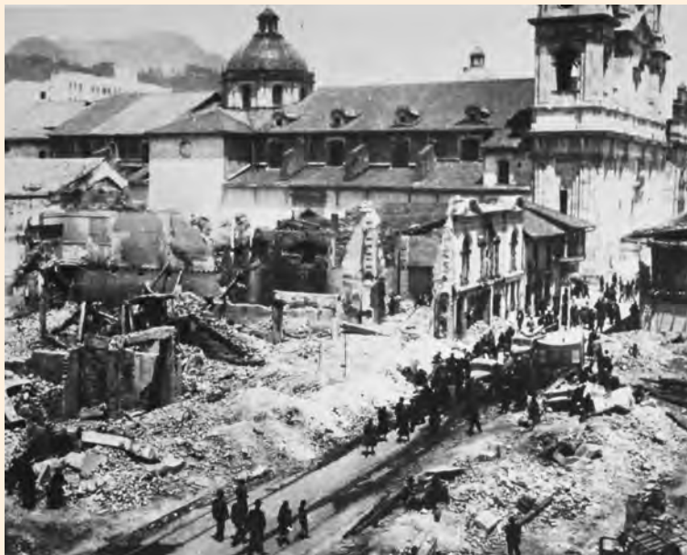
CARRERA SÉPTIMA ENTRE CALLES 11 Y 12. 1948. ESTADO EN QUE QUEDARON LAS MANZANAS DE ESTAS CALLES LUEGO DEL BOGOTAZO DEL 9 DE ABRIL. LUÍS GAITÁN. COLECCIÓN MDB-IDPC.