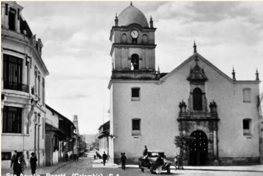
CALLE SÉPTIMA CON CARRERA SÉPTIMA. LA IGLESIA DE SAN AGUSTÍN LE DA LA ENTRADA A LA VÍA AL BARRIO DE SANTA BÁRBARA Y LAS CRUCES. 1940.