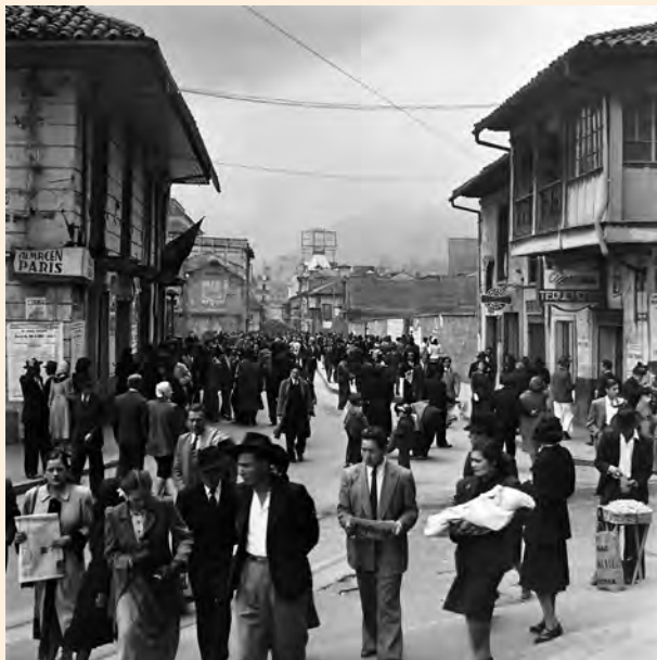
VISTA DE LA CARRERA SÉPTIMA HACIA EL NORTE DESDE EL ATRIO DE LA CATEDRAL EN LA CALLE 11, DONDE ES EVIDENTE EL LAMENTABLE ASPECTO DE DETERIORO DE LA VÍA LUEGO DE LOS DESTROZOS DEL 9 DE ABRIL, AL COSTADO DERECHO SE APRECIA LA CASA DEL FLORERO. CA 1950.