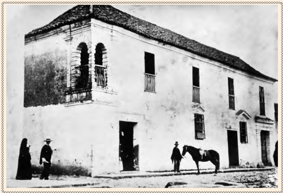
CASA DE LOS VIRREYES EN LA ESQUINA DE LA CALLE 20 CON CARRERA SÉPTIMA.