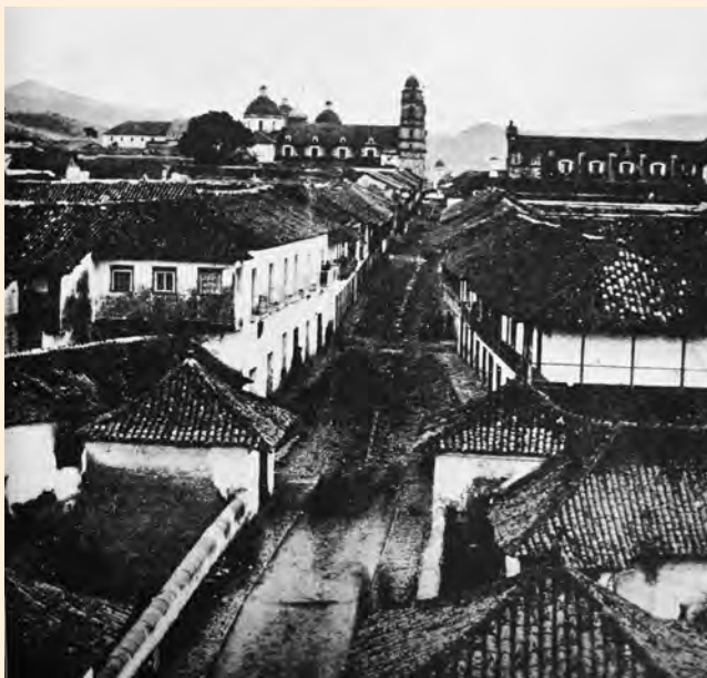
VISTA HACIA EL SUR DE LA CALLE REAL DESDE EL CAMPANARIO DE SAN FRANCISCO. 1901.