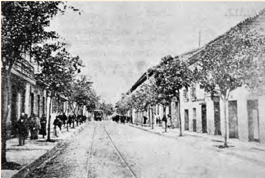
VISTA DE LA AVENIDA DE LA REPÚBLICA O CARRERA SÉPTIMA ENTRE CALLES 18 Y 19 A PRINCIPIOS DEL SIGLO XX. COLECCIÓN MDB-IDPC.