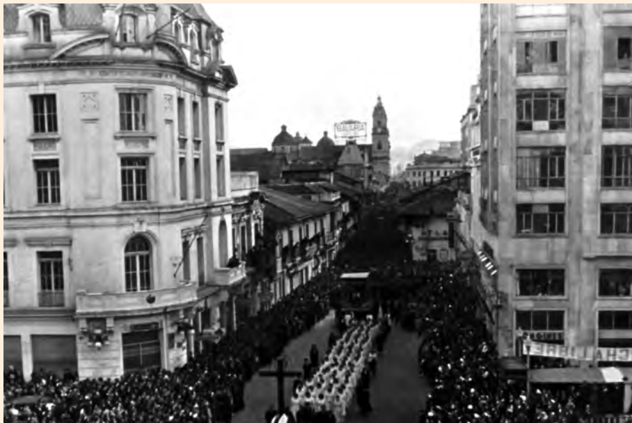
VISTA HACIA EL SUR DE LA CALLE REAL DESDE EL CAMPANARIO DE SAN FRANCISCO DURANTE UNA PROCESIÓN RELIGIOSA. CA. 1940.