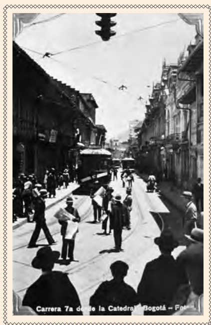
VISTA DE LA CARRERA SÉPTIMA HACIA EL NORTE DESDE EL ATRIO DE LA CATEDRAL EN LA CALLE 11 HACIA 1920. ARCHIVO JVOR-SMOB.