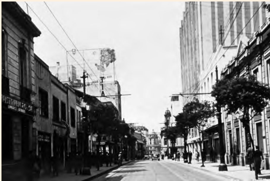
VISTA DE LA CARRERA SÉPTIMA DESDE LA CALLE 18 HACIA EL SUR. 1952.