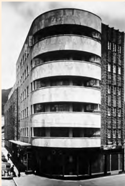
EDIFICIO ALBERTO SANZ. ESQUINA DE LA CALLE 20 CON CARRERA SÉPTIMA.