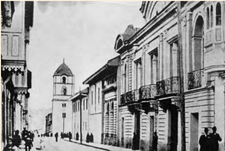
PALACIO DE LA CARRERA Y VISTA HACIA EL SUR DE LA SÉPTIMA, AL FONDO LA TORRE DEL CAMPANARIO DE LA IGLESIA DE SAN AGUSTÍN. 1918. LIBRO AZUL DE COLOMBIA. COLECCIÓN MDB-IDPC.