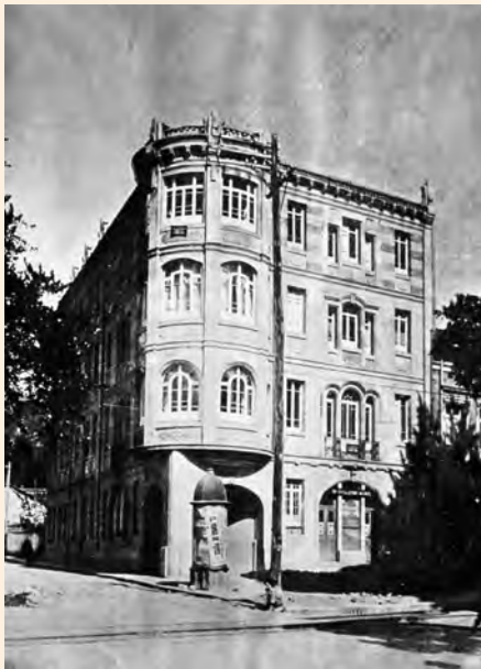
EDIFICIO MOLINO DE LA UNIÓN. ESQUINA DE LA CALLE 24 CON CARRERA SÉPTIMA. 1930.