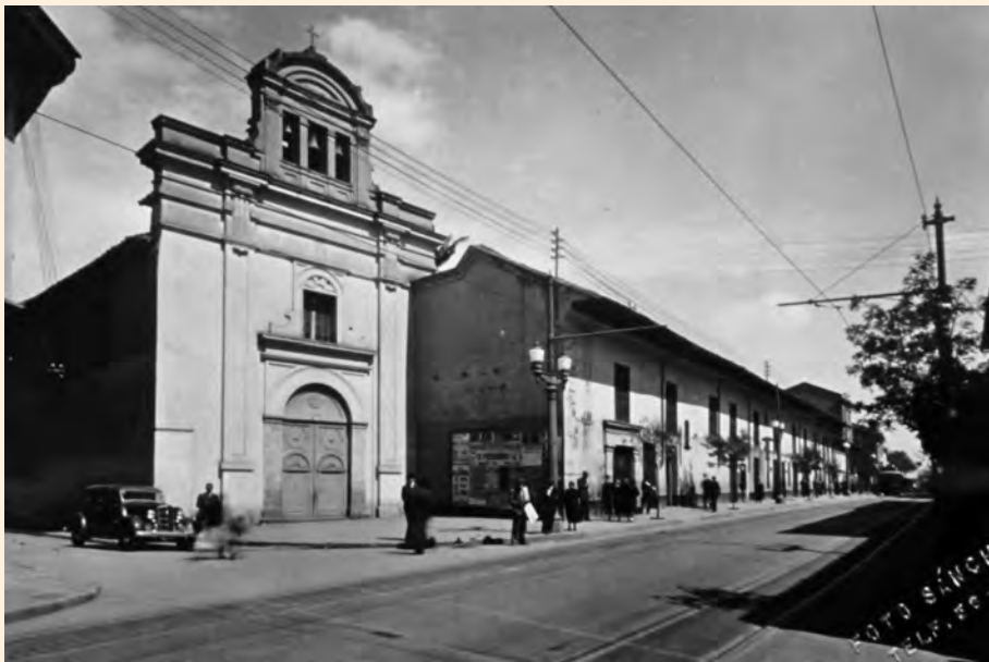
REAL HOSPICIO EN LA ESQUINA DE LA CALLE 18 CON CARRERA SÉPTIMA. 1915.