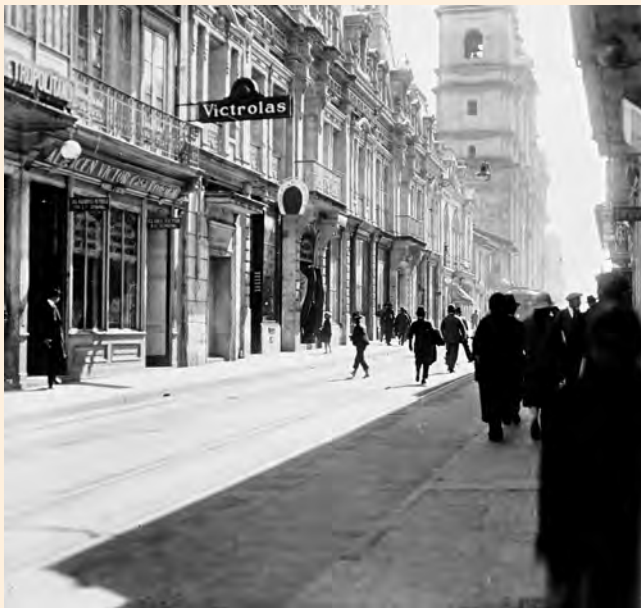
CARRERA SÉPTIMA ENTRE CALLES 11 Y 12. CA. 1920. SE APRECIA LA FACHADA DEL HOTEL ATLÁNTICO INCENDIADO EL 9 DE ABRIL DE 1948. COLECCIÓN MDB-IDPC.