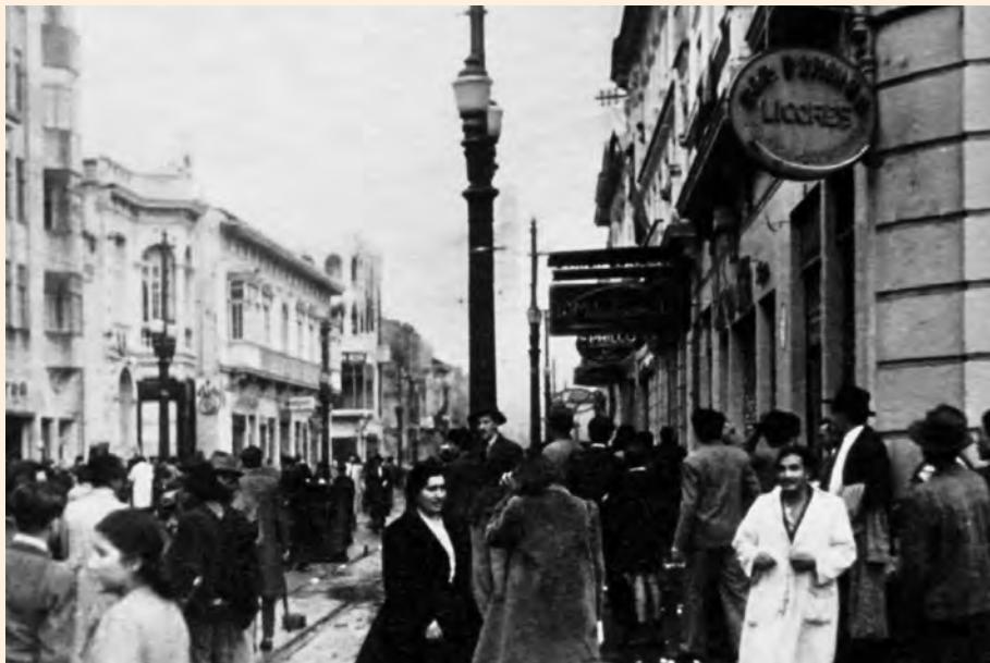
CALLE 20 CON CARRERA SÉPTIMA Y AL FONDO CALLE 19. IMAGEN CAPTADA AL PARECER DURANTE EL BOGOTAZO DEL 9 DE ABRIL.