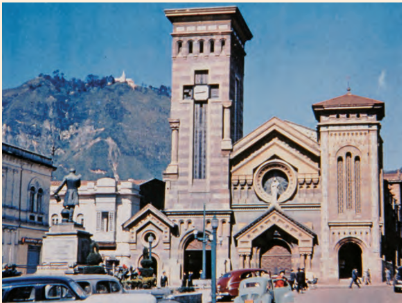
IGLESIA DE LAS NIEVES HACIA LOS AÑOS CINCUENTA. COLECCIÓN MDB-IDPC.