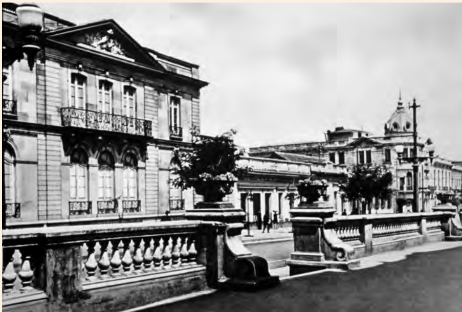
BALAUSTRADA DEL TERRAZA PASTEUR Y CASA DE MERCEDES SIERRA. CALLE 24. 1938.