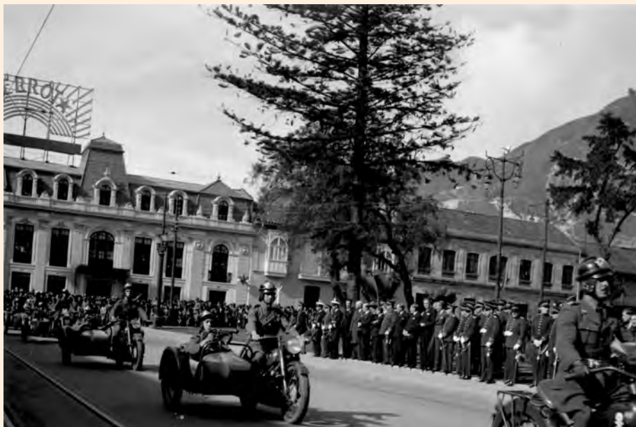
DESFILE MILITAR FRENTE AL PARQUE SANTANDER. AL FONDO EL DESAPARECIDO HOTEL REGINA INCENDIADO EL 9 DE ABRIL DE 1948. 1937.