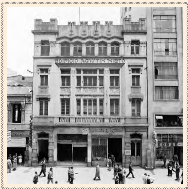
DESAPARECIDO EDIFICIO AGUSTÍN NIETO EN LA AVENIDA JIMÉNEZ CON CARRERA SÉPTIMA. CA. 1950. COLECCIÓN MDB-IDPC.