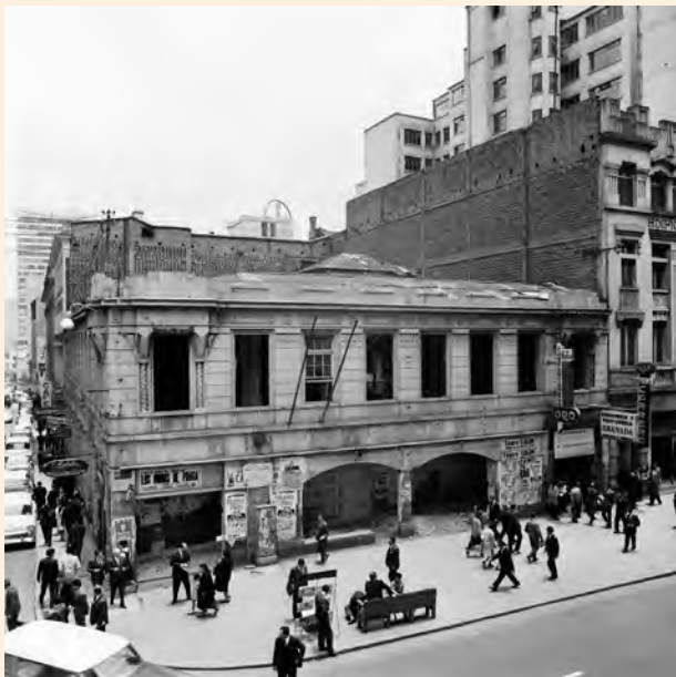
ESQUINA DE LA CALLE 14 CON CARRERA SÉPTIMA.