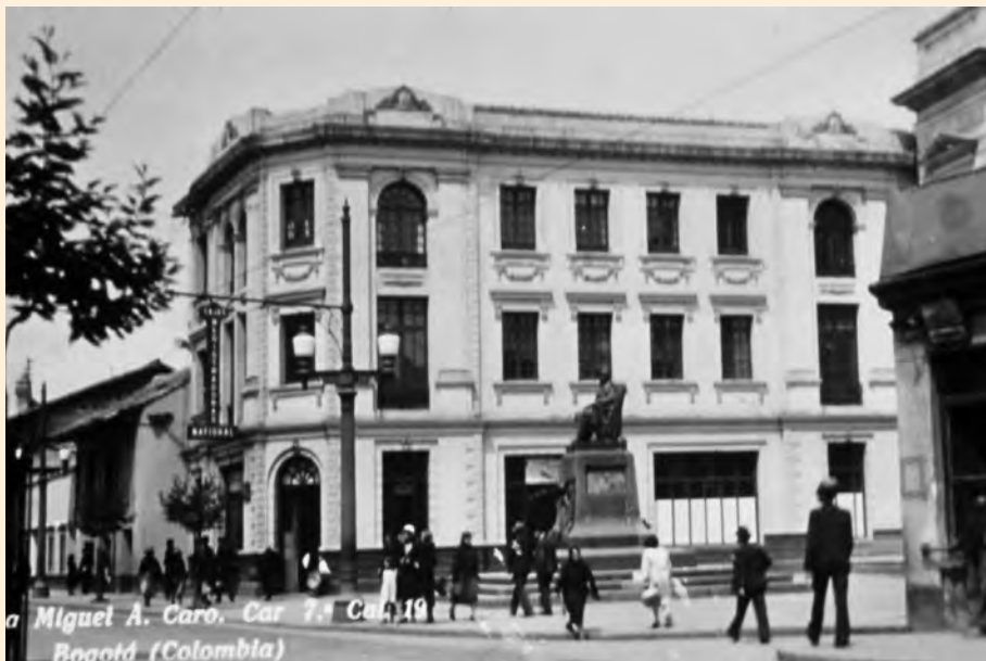
VISTA DE LA ESQUINA DE LA CALLE 19 CON CARRERA SÉPTIMA. EN ESTE ESPACIO SE ENCONTRABA UNA PLAZOLETA Y UNA ESCULTURA EN HOMENAJE A MIGUEL ANTONIO CARO Y LA SEDE DE LA REAL ACADEMIA DE LA LENGUA, INCENDIADA EL 9 DE ABRIL DE 1948. 1945.