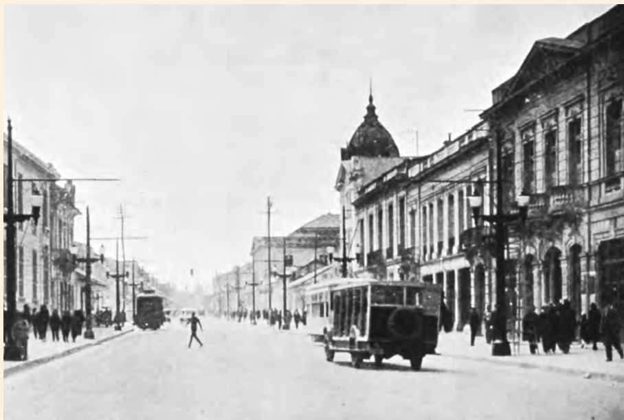
AVENIDA DE LA REPÚBLICA. CALLE 25. 1929. COLECCIÓN MDB-IDPC.