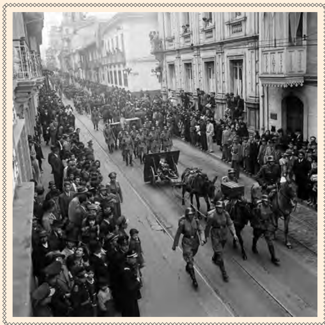
DESFILE MILITAR A SU PASO POR EL PALACIO DE LA CARRERA, CALLE OCTAVA, 1945. DANIEL RODRIGUEZ. COLECCIÓN MDB-IDPC.