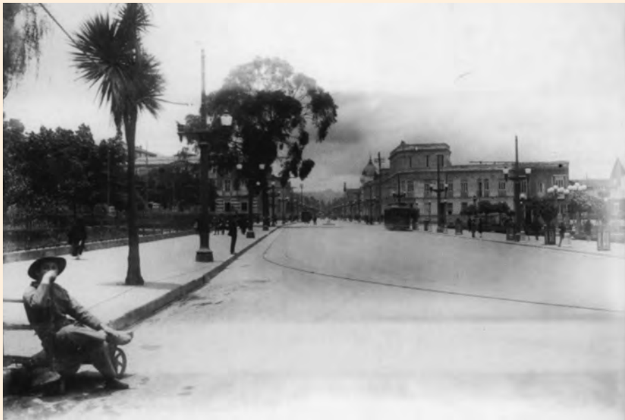
CARRERA SÉPTIMA FRENTE AL PARQUE DE LA INDEPENDENCIA. ESTE ERA EL MAJESTUOSO ASPECTO DEL ANTIGUO PORTAL DE ENTRADA HACIA EL CENTRO DE LA CIUDAD, EN LA ESQUINA DEL COSTADO DERECHO HOY SE ENCUENTRA EL EDIFICIO COLPATRIA.