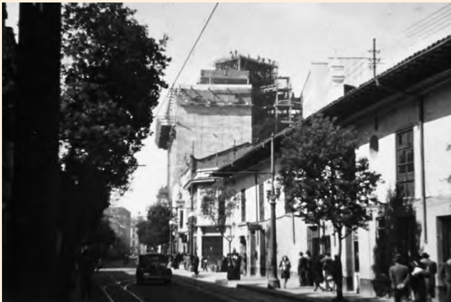
VISTA DE LA CARRERA SÉPTIMA DESDE EL REAL HOSPICIO EN LA CALLE 18. SE OBSERVA LA CONSTRUCCIÓN DEL EDIFICIO DE LA COMPAÑÍA COLOMBIANA DE SEGUROS. 1948.