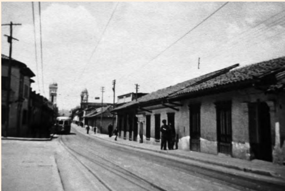
CARRERA SÉPTIMA CON CALLE CUARTA. SE APRECIAN LA CASA DEL ESCRITOR Y POLÍTICO LUIS VARGAS TEJADA Y AL FONDO LAS TORRES DE LA IGLESIAS DE LA PLAZA DE LAS CRUCES. 1947.