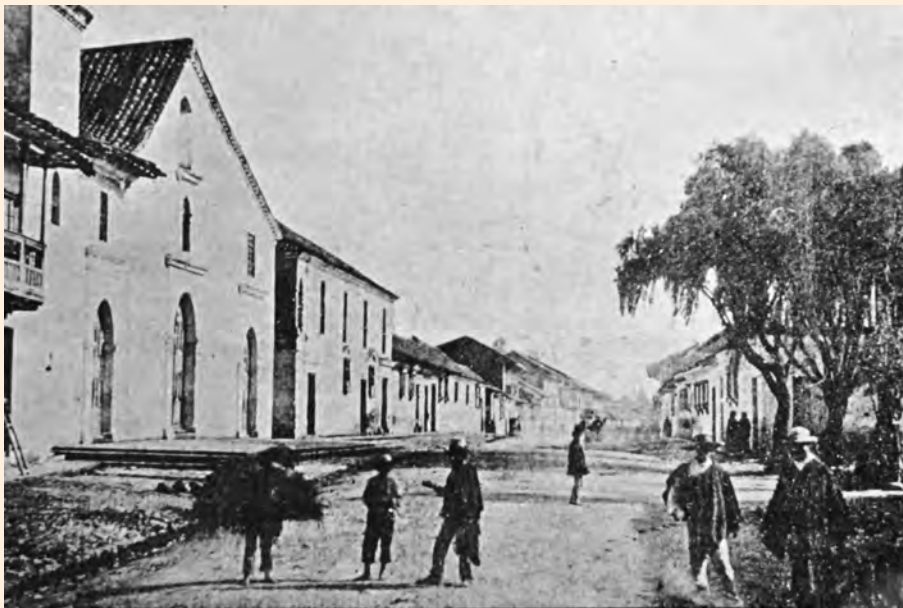
ANTIGUA IGLESIA DE LAS NIEVES. CALLE 20.