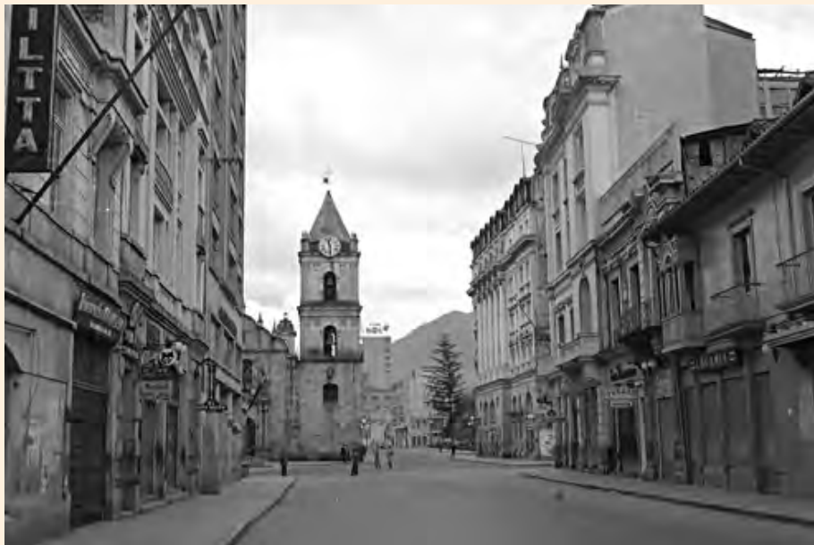
VISTA HACIA EL NORTE DE LA CALLE JIMÉNEZ CON SÉPTIMA. 1952. SAUL ORDUZ. COLECCIÓN MDB-IDPC.