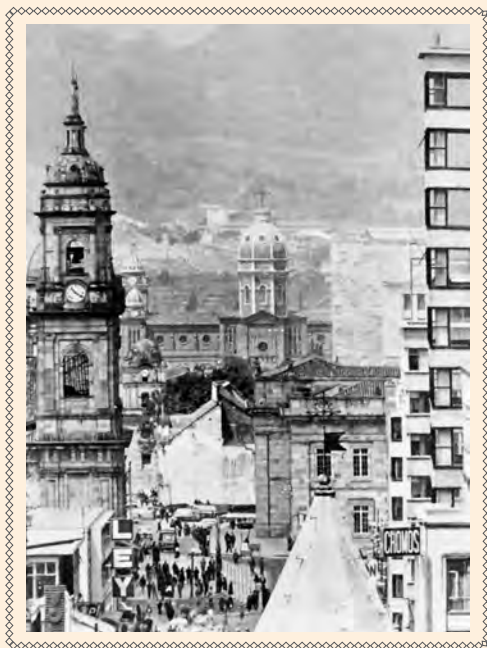
VISTA HACIA EL SUR DE LA CARRERA SÉPTIMA. SE APRECIAN LOS CAMPANARIOS DE SAN FRANCISCO, LA CATEDRAL, SAN AGUSTÍN Y AL FONDO LA CÚPULA DE LA IGLESIA DE LAS CRUCES. GUILLERMO ANGULO. COLECCIÓN MDB-IDPC.